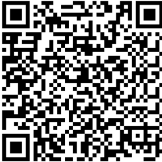
QR Code - Caixa Econômica Federal