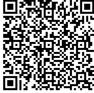
QR Code - Banco do Brasil