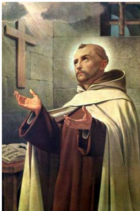
São João da Cruz

Em vez de nos concentrarmos na culpa do cônjuge, devemos perguntar ao dirigido o que ele tem feito para ser um bom marido ou uma boa mulher; devemos lembrá-lo de que ele deve amar o cônjuge “ não somente por aquilo que dele recebe, mas por ele mesmo, por poder enriquecê-lo com o dom de si próprio ” 4 ; devemos aconselhá-lo a chamar diariamente o outro para rezar o terço em família, mesmo que seja somente para ouvir “ não ”; devemos citar a célebre frase de São João da Cruz (1542-1591): “ onde não há amor, põe amor e encontrarás amor ” 5 .